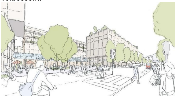
Neuer Metalliplatz (Sicht von der Bahnhofseite)

Schon heute ist die Metalli der meistfrequentierte Ort der Stadt Zug: Viele Menschen verbringen hier ihre Mittagspause, kommen zum Einkaufen, oder wohnen und arbeiten in diesem Teil der Stadt. Mit zusätzlichen und vergrösserten, öffentlichen Plätzen und einer Öffnung Richtung Bahnhof wird die Metalli künftig verstärkt zum Ort für gesellschaftliche und kulturelle Aktivitäten und Begegnungen. Mit dem neuen Bebauungsplan werden die Freiräume viel grüner gestaltet und mit grossen Bäumen versehen, die im Sommer Schatten spenden, eine attraktive Atmosphäre schaffen und das Stadtklima verbessern.