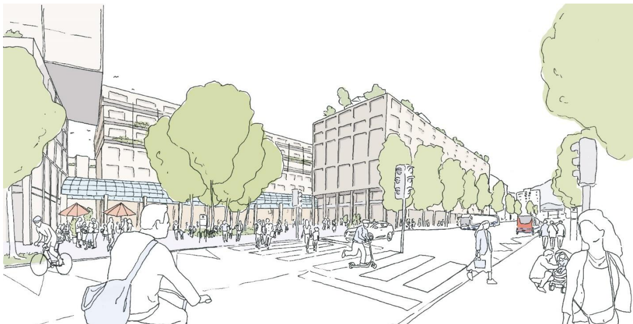
Der neue, grosszügige und begrünte Metallplatz (Sicht von der Bahnhofsseite) vernetzt den Lebensraum Metall mit dem direkten Fussweg zum Bahnhof.