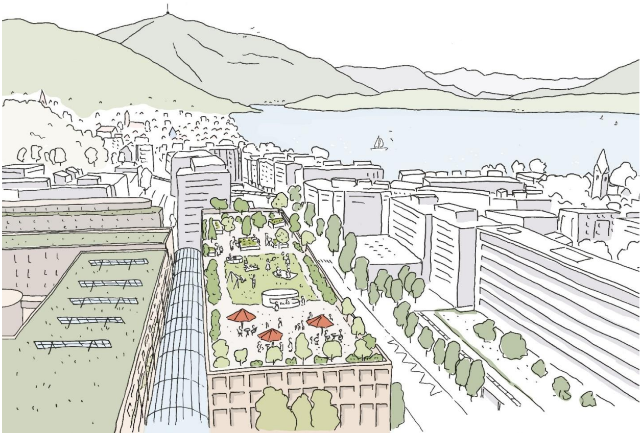
Öffentliche parkähnliche Dachterrasse mit Sicht auf den Zugersee und die Rigi.