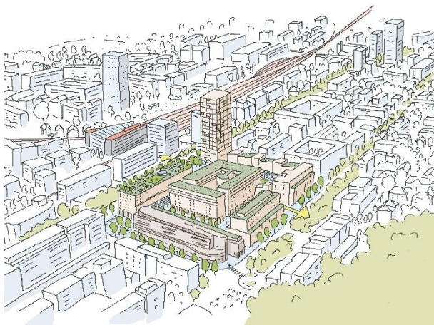
Vogelperspektive auf die weiterentwickelte Metalli